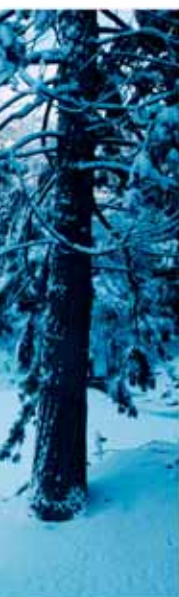
Gyorsan stabilizálódó képek lenyűgöző tartóssággal és élettartammal